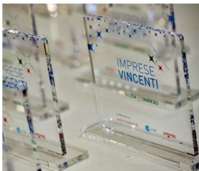
Il totem che viene consegnato alle imprese vincitrici del progetto

MILANO Il digital tour, partito ieri, di «Imprese Vincenti 2021» è il progetto di Intesa Sanpaolo per la valorizzazione delle piccole e medie imprese italiane, che mai come quest'anno punta alla centralità del sistema delle imprese come motore della ripartenza del Paese dopo i lunghi e difficili mesi della pandemia. Le 112 imprese selezionate – tra cui la Bonetti Costruzioni Meccaniche di Castelleone – stanno alimentando la fiducia e il rilancio dell'economia dei territori e dell'intero Paese e che Intesa Sanpaolo e i partner di progetto intendono valorizzare per dare ancora maggior forza ai segnali positivi presenti nel panorama imprenditoriale italiano in una fase così unica e importante co-